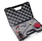
KIT COMPAS DELUXE Código 2482900