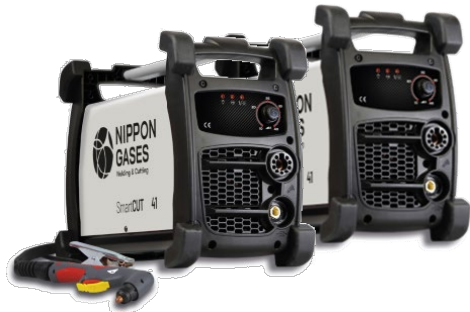
Smartcut 41 y 41 Compresor