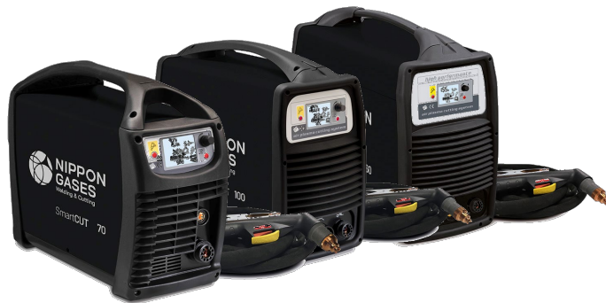
Smartcut 70, 100 y 120 CNC

La familia Smartcut esta formado por los equipos de corte por plasma monofásicos Smartcut 41 y 41 Compresor y por los trifásicos Smartcut 70, 100 y 120 CNC de tecnología Inverter de encendido por contacto, y de reducido tamaño y peso.