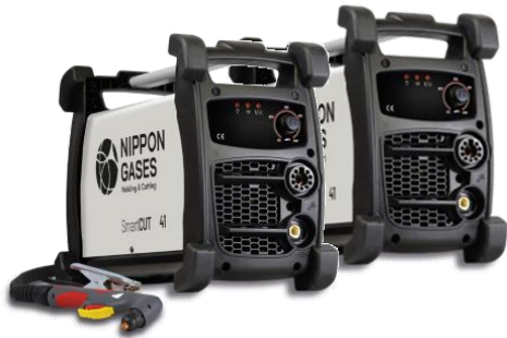
Smartcut 41 y 41 Compresor