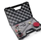
KIT COMPAS DELUXE Código 2482900