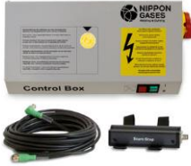
Sensor marcha- paro