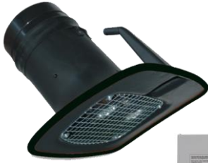
Conjunto de iluminación